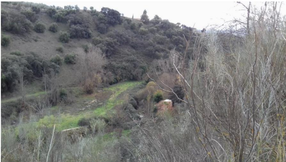
Panorámica de la zona de la EBAR principal (a la derecha) y camino (a la izquierda)

La principal Estación de Bombeo (EBAR) de Arriate se encarga de recolectar todas las aguas residuales del municipio y las transporta hasta la Planta de tratamiento, situada a uno 100 metros de distancia. La ubicación de la EBAR se encuentra en una parcela con una altitud de 560 msnm, cerca del cauce del río Guadalcobacín y al Noreste de la EDAR, pero fuera de los límites de DPH y la zona de servidumbre. Se iniciaron los trabajos con la limpieza exhaustiva del terreno, eliminando cuidadosamente la vegetación, escombros y otros materiales existentes en el área.