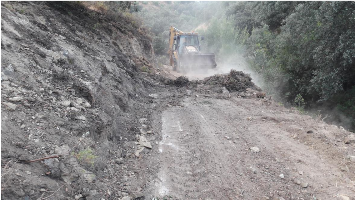
Desbroce en el camino

estrato de roca arenisca (UE 002) de una potencia media de 2'70 metros. No hay indicios arqueológicos.