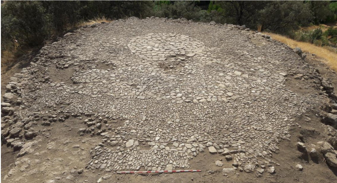
Vista final de la era

El muro conserva una altura máxima de 1 metro y está hecho a base de mampostería caliza de tamaño mediano y grande, sin ligante, dispuesta aleatoriamente para encajar entre sí los distintos mampuestos.