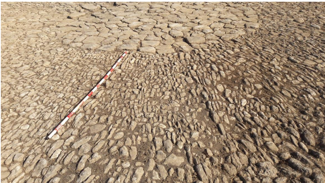
Pavimento con nervios radiales (B)

Desde el pavimento de lajas parten once nervios radiales formados por una o varias hileras de mampuestos colocados de manera vertical o como lajas, a modo de marco. Dentro de estos espacios se disponen mampuestos verticales, mayoritariamente siguiendo la dirección de los nervios. Esta disposición permitía una mejor trilla del grano. En la unión de este pavimento (B) con el muro perimetral se dispone una fila de mampuestos verticales en paralelo al muro. La separación entre los nervios es de 0'90 metros en el centro y de 2'60 metros en el exterior.