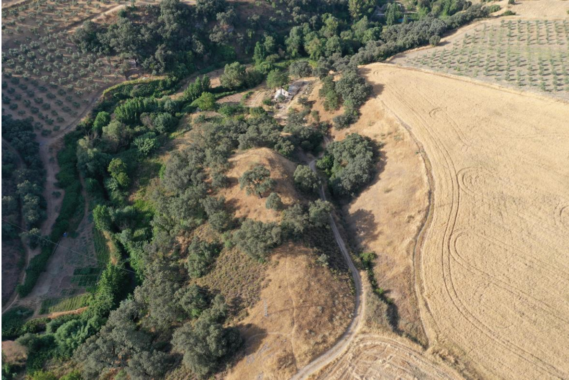
Detalle de la parcela de la Planta de la EDAR

Además de la Planta de la EDAR, el proyecto de obra incluye un bombeo de entrada a la Planta (EBAR), una segunda EBAR en el Polígono Industrial y 1'030 km totales de conducción, de los que 329 metros son por impulsión.