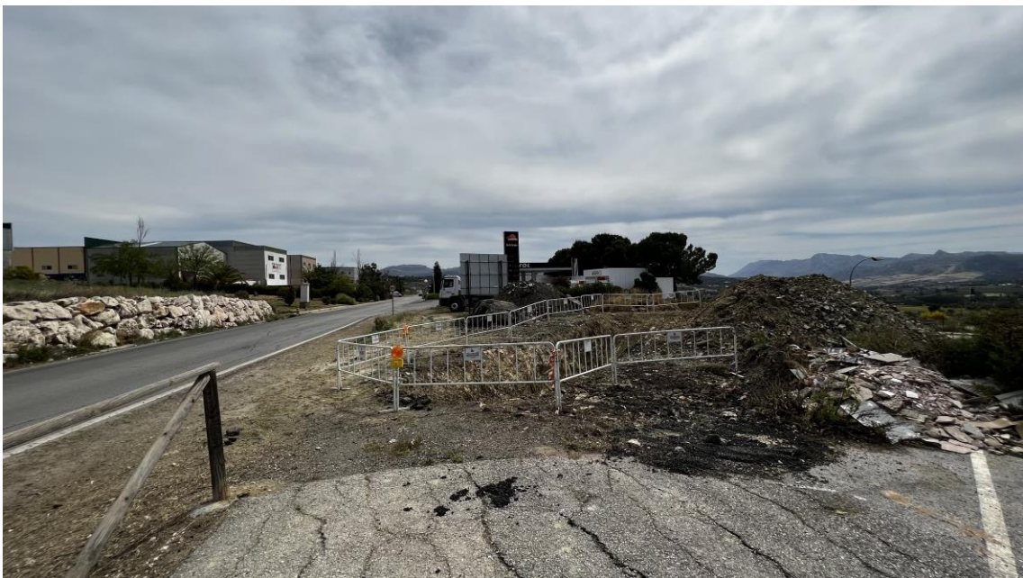
Carretera MA-7400 en el cruce de la Impulsión del Polígono con hinca (Colector I2)

Durante la ejecución de los trabajos en los colectores de la EDAR y de las dos EBAR se ha realizado la apertura de zanjas y de pozos. En primer lugar, se realizan diversas zanjas para los colectores. A continuación, se excavan los pozos y se realiza alguna roturación del terreno. La red de colectores está formada por: Colector G2, Colector G1, Colector I1, Colector I2, Colector G3, Colector G4, Colector G5 y Colector G6.