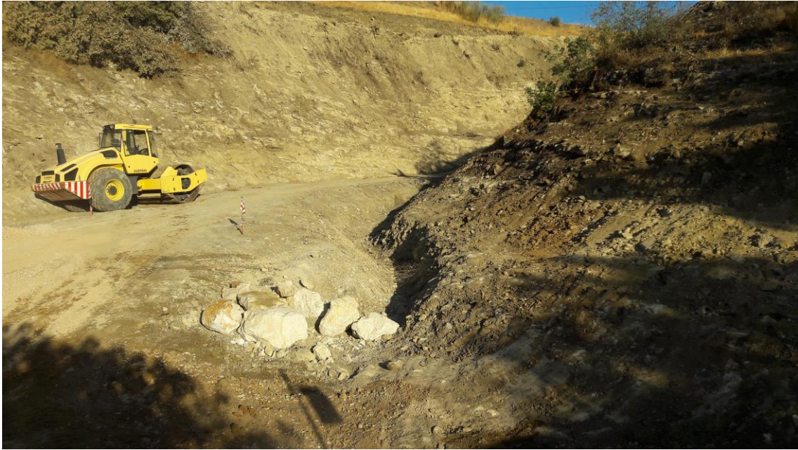
Obras de drenaje en el arroyo

Al otro lado del arroyo (Oeste) se desbroza la ladera y se va excavando un camino para que pueda trabajar mejor la máquina en las labores de realización del talud.