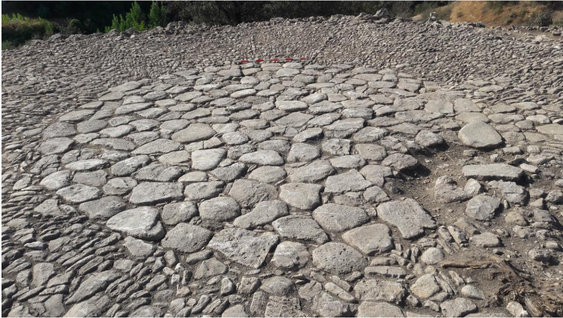
Detalle del pavimento central de la era (A)

Desde el pavimento de lajas parten once nervios radiales formados por una o varias hileras de mampuestos colocados de manera vertical o como lajas, a modo de marco. Dentro de estos espacios se disponen mampuestos verticales, mayoritariamente siguiendo la dirección de los nervios. Esta disposición permitía una mejor trilla del grano. En la unión de este pavimento (B) con el muro perimetral se dispone una fila de mampuestos verticales en paralelo al muro. La separación entre los nervios es de 0'90 metros en el centro y de 2'60 metros en el exterior.