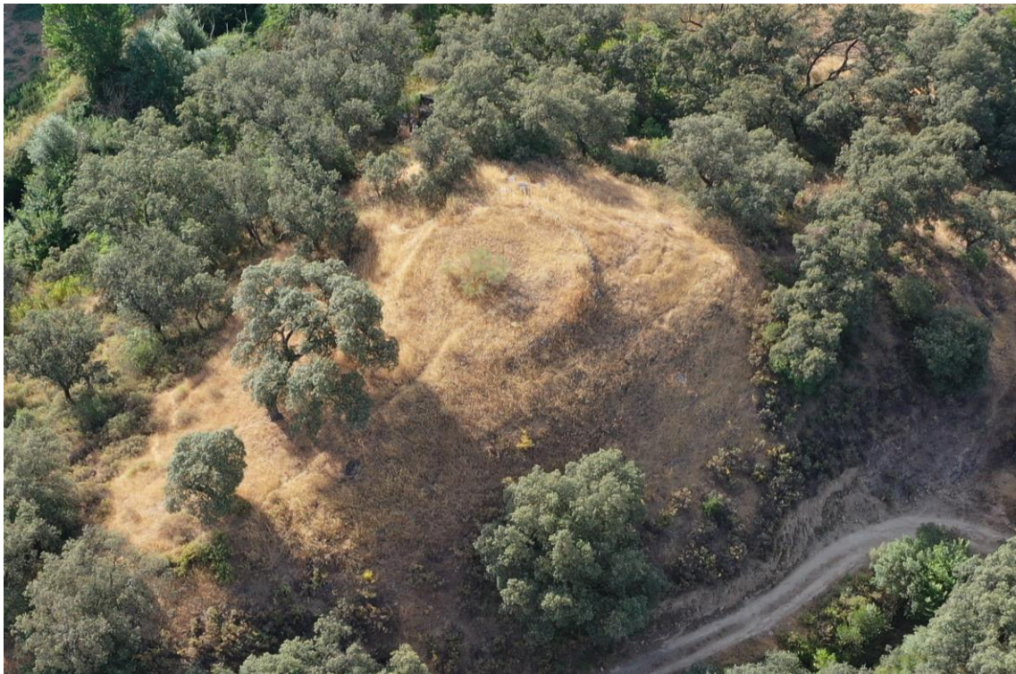
Vista aérea del cerro con la era

En el extremo Sur del cerro se conserva una era contemporánea, de la que se observa parte del muro perimetral y del pavimento central. Dicha era no se encuentra catalogada, ni dispone de protección alguna.