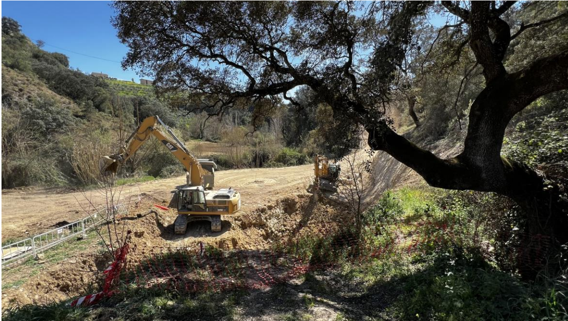
Trabajos de excavación para la cimentación de la estructura de la EBAR principal

Una vez completado el desbroce, se procedió a la excavación necesaria para la cimentación de la estructura de la EBAR. Este proceso abarcó la excavación para los pozos de bombeo, los tanques de almacenamiento y las canalizaciones.