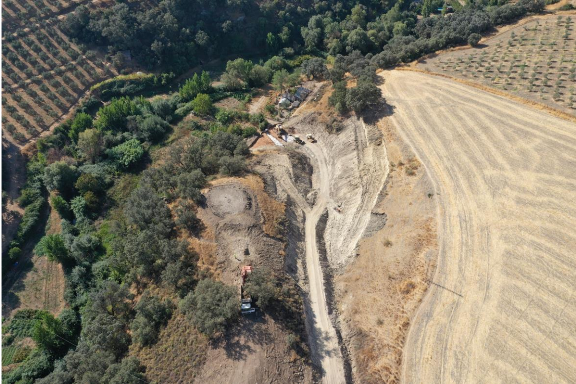
Vista aérea de las obras