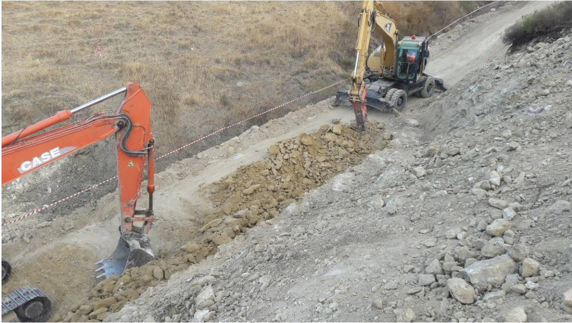
Roca rojiza UE 003 en el talud del camino