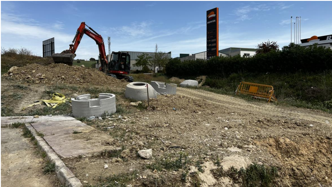
Desbroce y limpieza de terreno donde irá ubicada la EBAR del Polígono

En la EBAR del Polígono Industrial se excava y nivela el terreno para la cimentación de la estructura y se realizan trabajos de preparación del talud, como la construcción de terraplenes y muros de contención.