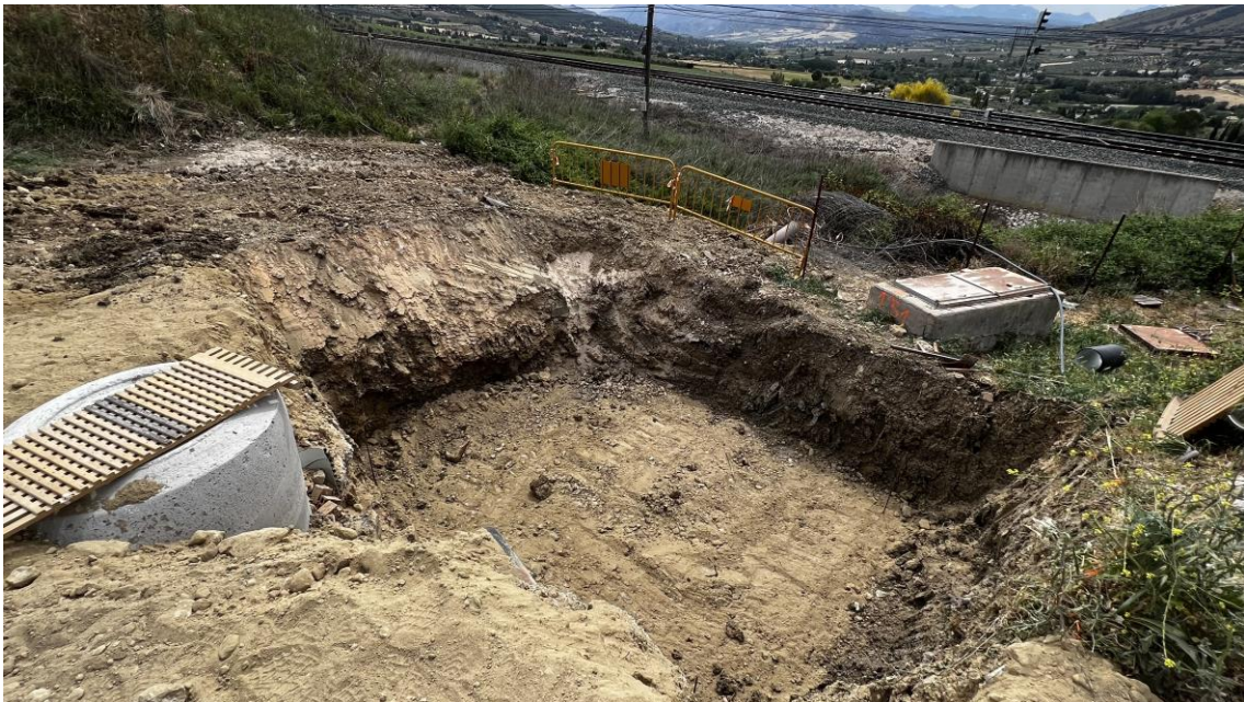
Trabajos de excavación para preparar la cimentación de la EBAR del Polígono

El perfil estratigráfico en esta zona está formado por una capa de tierra, UE 001, de 0'50 metros de grosor y un estrato de arcillas margosas y limos, UE 002, de 1'90 metros de potencia. No se observan indicios arqueológicos de ningún tipo.