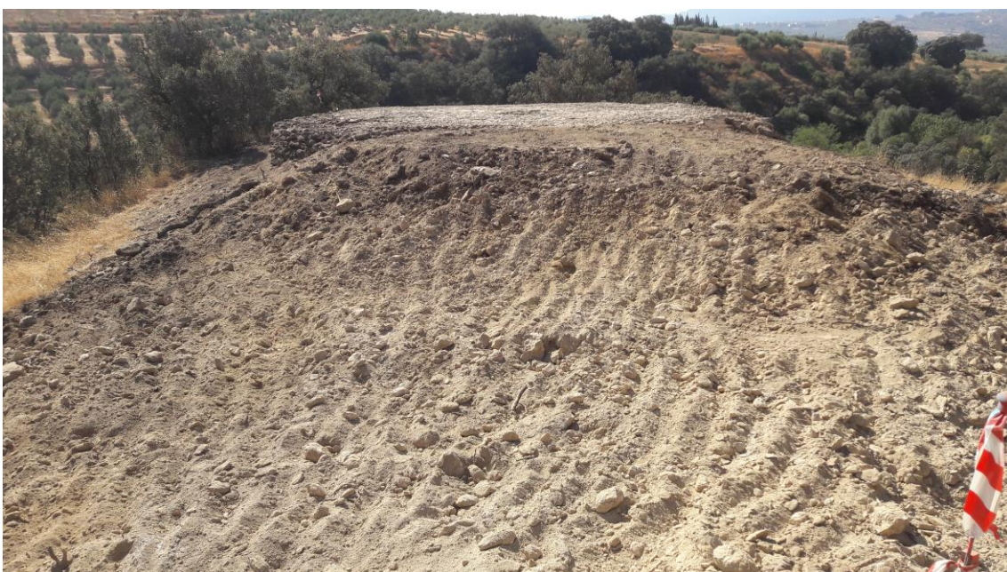
Desmante del cerro

Posteriormente, se procede a trabajar con máquina giratoria en el cerro. Se inicia, así, el rebaje mecánico alrededor de la era, donde sale mucha piedra.