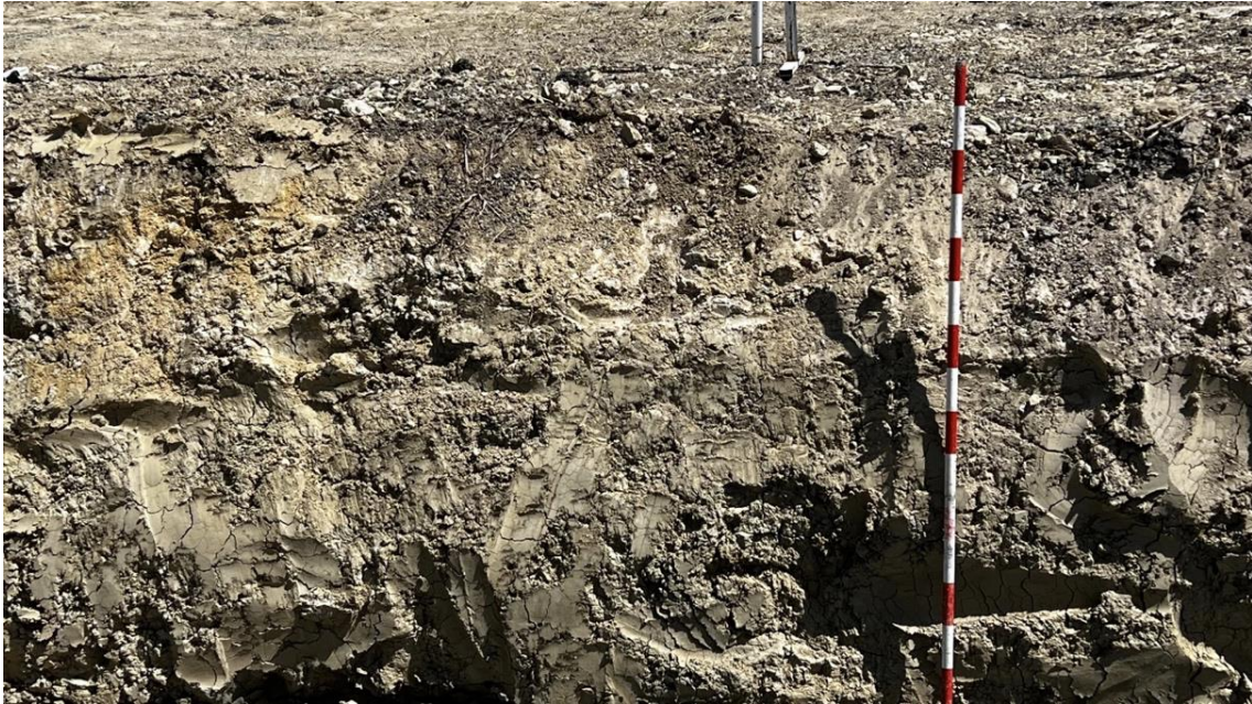
Perfil estratigráfico del sondeo del Colector de Impulsión I2 de la EBAR del Polígono