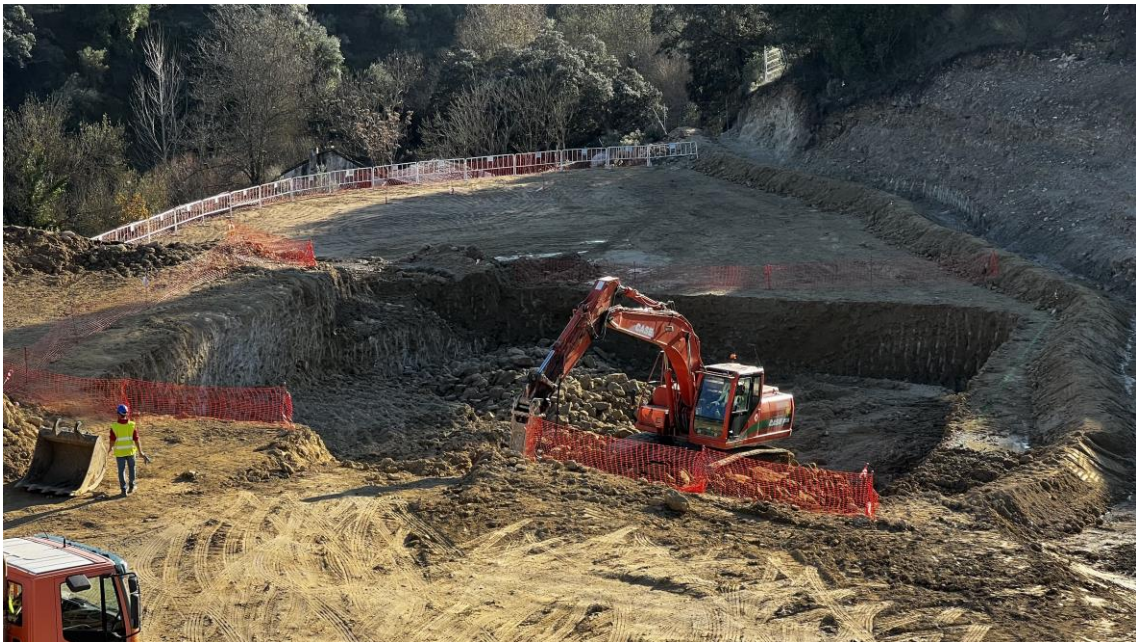
Rebaje mediante picado donde irá ubicado el reactor biológico

Al mismo tiempo, se ha comenzado a trabajar en la plataforma, rebajando mediante picado donde irá ubicado el reactor biológico.