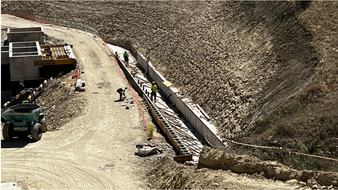
Trabajos en el canal de drenaje perimetral de la EDAR