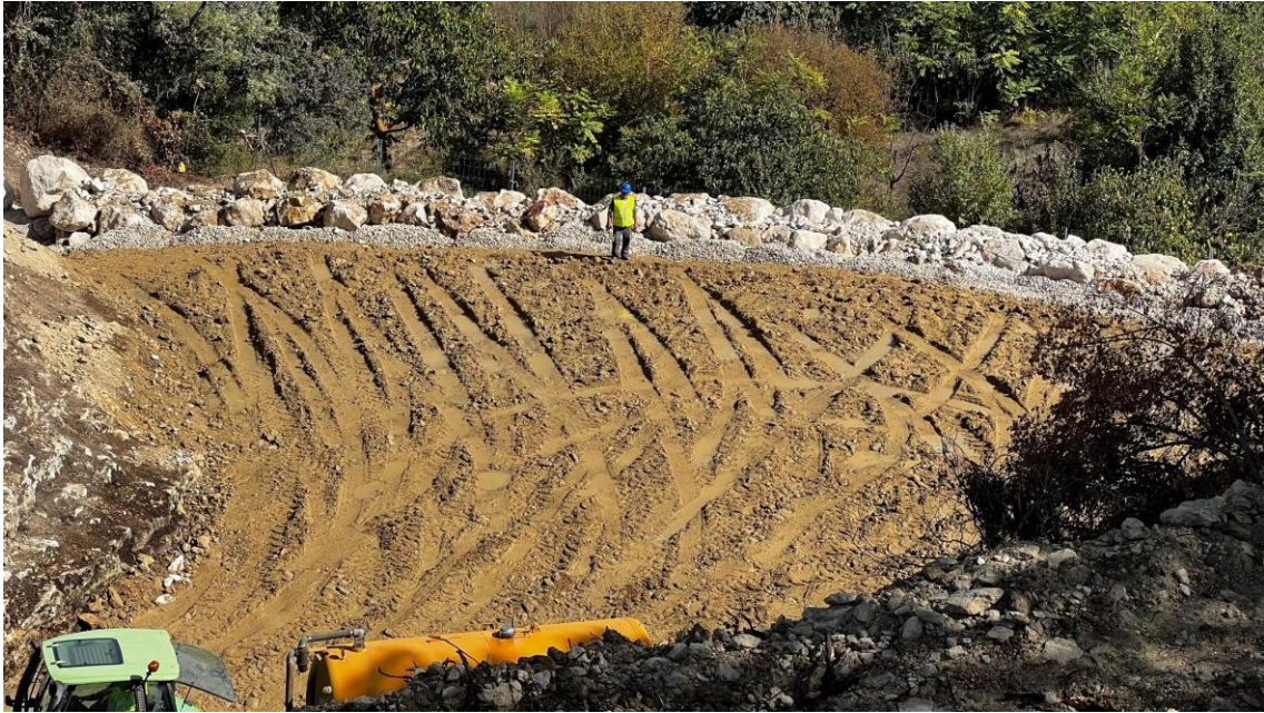
Muro de escollera y compactación del terreno

Al mismo tiempo, se ha comenzado a trabajar en la plataforma, rebajando mediante picado donde irá ubicado el reactor biológico.