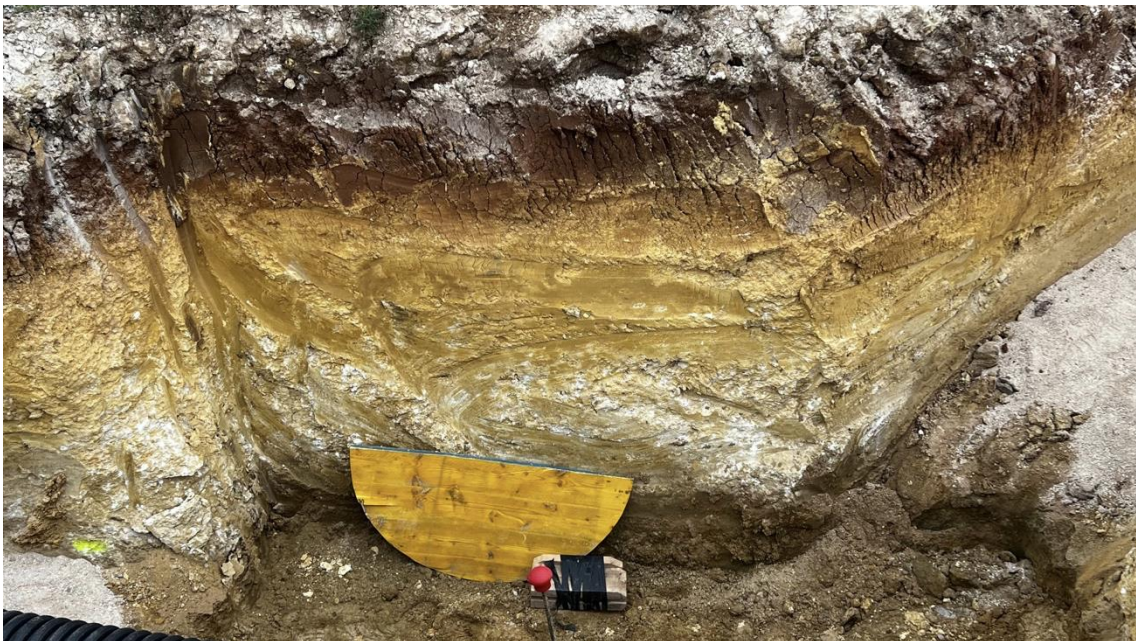
Perfil estratigráfico del sondeo del Colector de gravedad G4, pozo nº 8

El perfil estratigráfico en esta zona está formado por un único estrato de arcillas margosas y limos de distinta coloración, de 1'20 metros de potencia, UE 001, color marrón, de 0'35 metros, UE 002, color amarillento, de 0'70 metros y UE 003, color marrón, de 0'15 metros. No se observan indicios arqueológicos de ningún tipo.