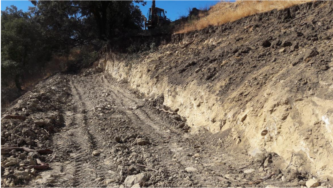
Excavación en la ladera Oeste

El perfil estratigráfico resultante en la ladera Oeste se compone de una capa de tierra vegetal (UE 001) de 1'70 metros de potencia y de un estrato arenisco (UE 002) de 1'10 metros de potencia. No hay indicios arqueológicos.