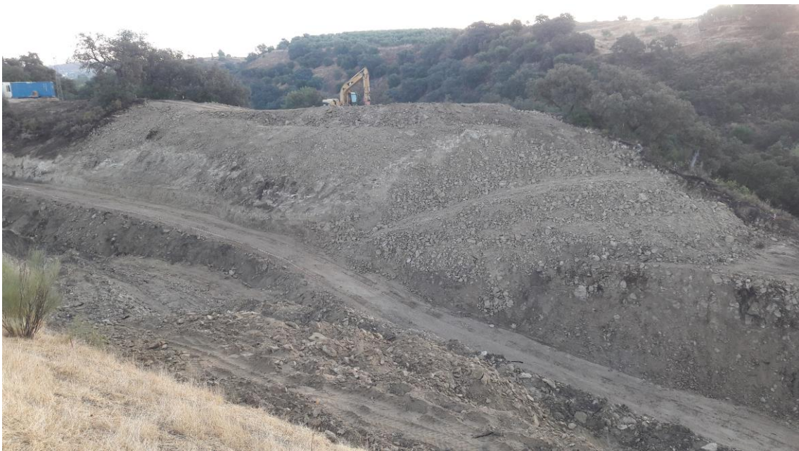
Vista del cerro desde la ladera Oeste

También se trabaja en el camino que desciende junto al arroyo recortando el talud del cerrete. Aparece ahora bajo la roca UE 002 una roca tosca de coloración rojiza, UE 003, que se disgrega fácilmente con la máquina.