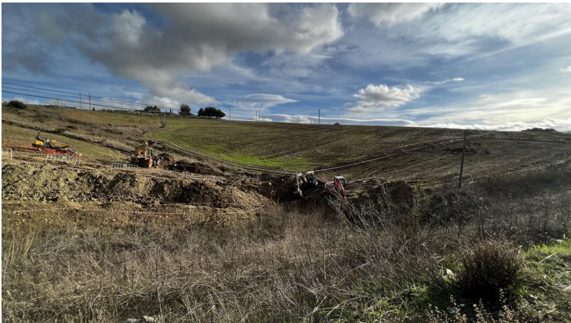
Trabajos en el Colector I2