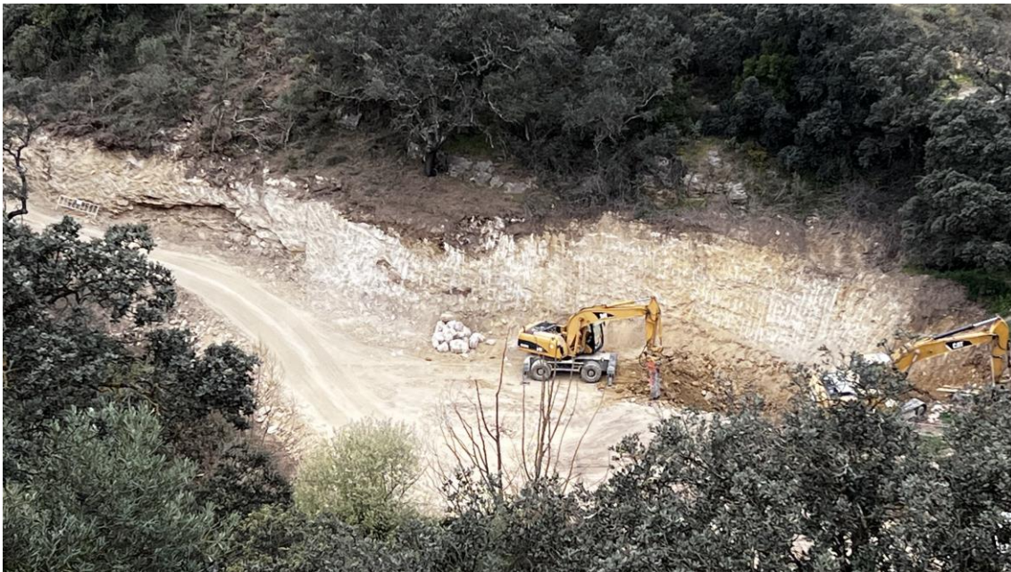
Rebaje del talud en la EBAR principal