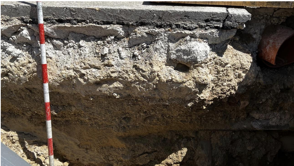
Perfil estratigráfico del sondeo del Colector de gravedad G4, pozo nº 33

El perfil estratigráfico de G4 está formado por una capa de asfalto, UE 001, de 0´05 metros de grosor, una cama de hormigón, UE 002, de 0´20 metros, una capa de zahorra, UE 003, de 0´15 metros, y un estrato de areniscas calcáreas biocalcarenitas, UE 004, de 0´45 metros de potencia. No se observan indicios arqueológicos de ningún tipo.