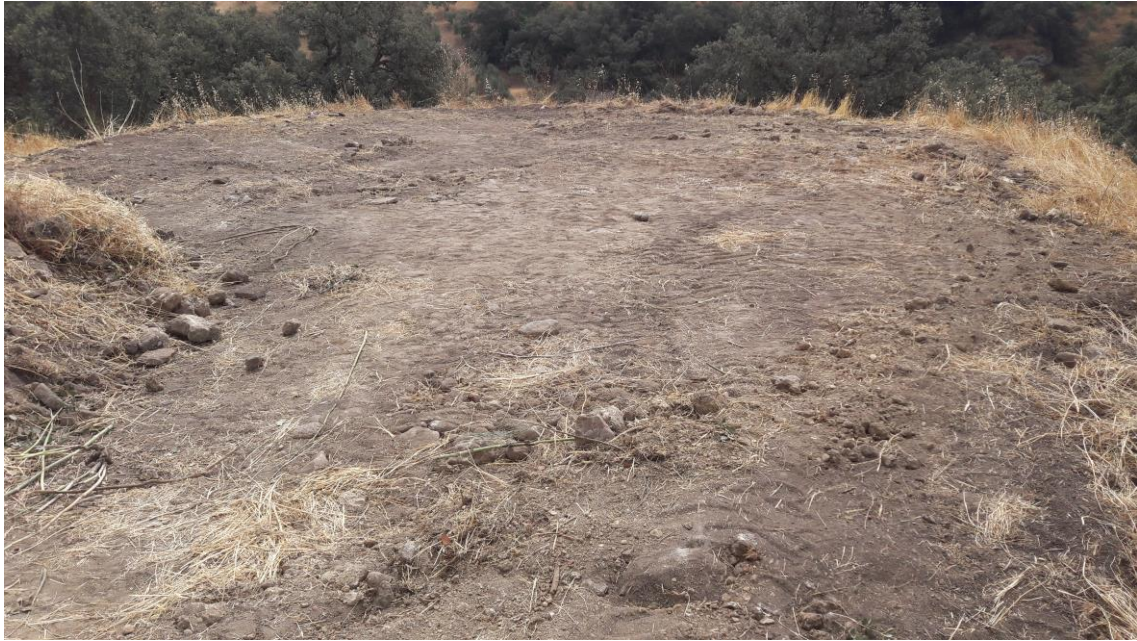
Extremo Sur del cerro desbrozado

En el extremo Sur del cerro se conserva una era contemporánea, de la que se observa parte del muro perimetral y del pavimento central. Dicha era no se encuentra catalogada, ni dispone de protección alguna.