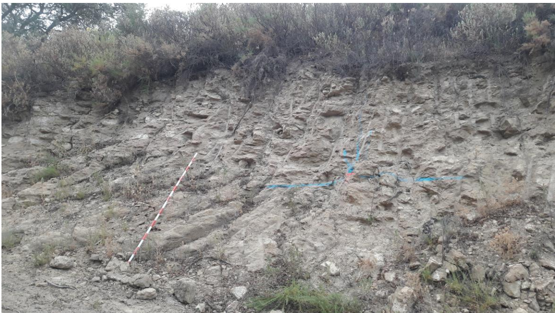
Perfil estratigráfico en el talud del camino