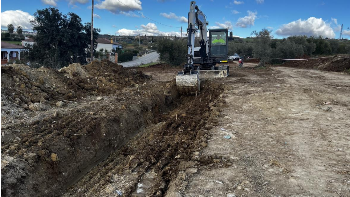
Trabajos de apertura de zanjas en Colector G4 (Urb. El Olivar)

El perfil estratigráfico en esta zona está formado por un único estrato de arcillas margosas y limos de distinta coloración, de 1'20 metros de potencia, UE 001, color marrón, de 0'35 metros, UE 002, color amarillento, de 0'70 metros y UE 003, color marrón, de 0'15 metros. No se observan indicios arqueológicos de ningún tipo.