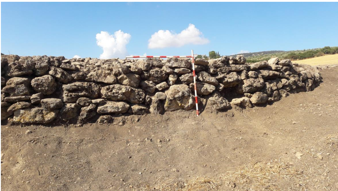
Muro perimetral de la era

El muro conserva una altura máxima de 1 metro y está hecho a base de mampostería caliza de tamaño mediano y grande, sin ligante, dispuesta aleatoriamente para encajar entre sí los distintos mampuestos.