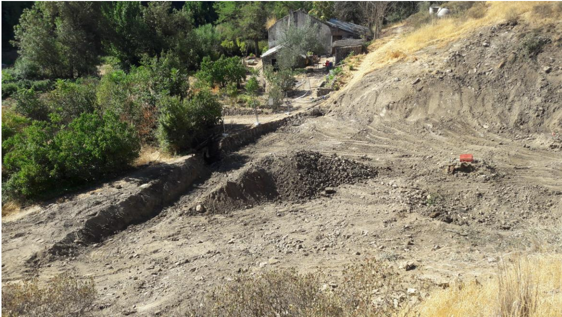
Zona para la escollera

Paralelamente, se empieza a trabajar en el punto más bajo de la parcela (S) para realizar una zanja donde se realizará una cimentación de hormigón a modo de zapata para el muro de escollera que soportará la plataforma de la Planta. Se llegan a excavar 3 metros de profundidad, afectando también al cauce del arroyo seco. El perfil estratigráfico resultante se compone de un nivel de relleno para nivelar el terreno.