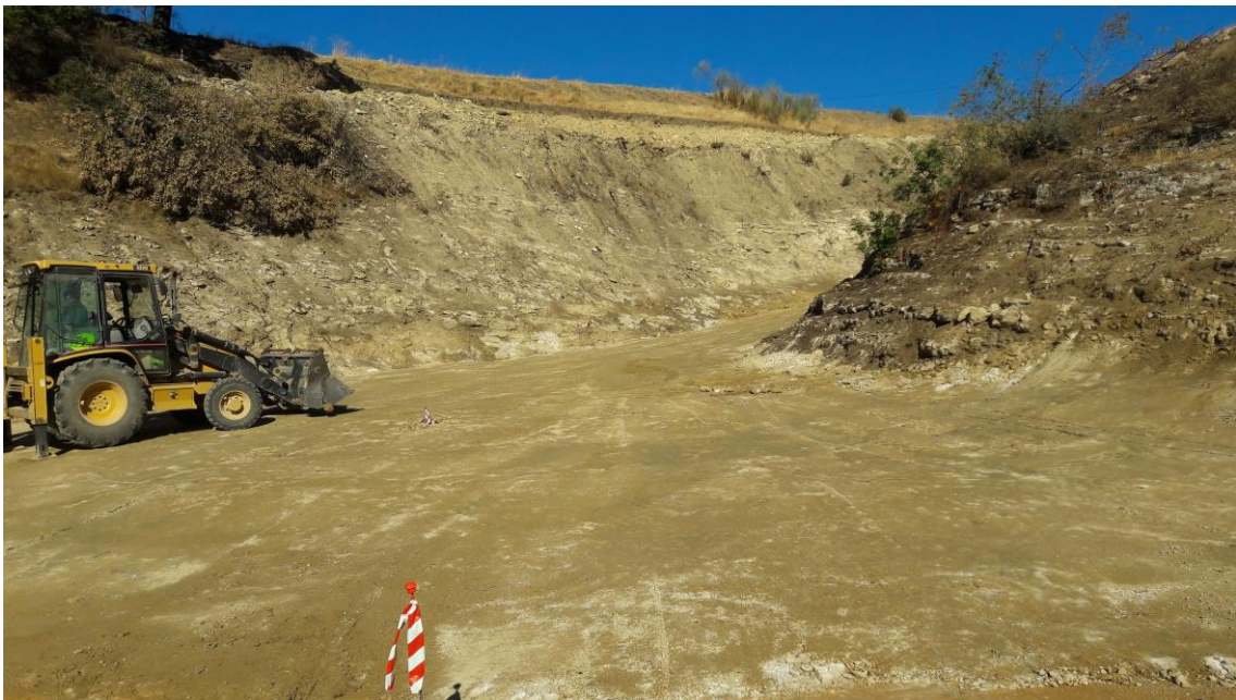
Zona baja (Sur) tras el relleno de zahorra y el compactado

En el cerro aparece un estrato potente de gravilla y cantos rodados de río (UE 006) bajo la roca arenisca UE 002.