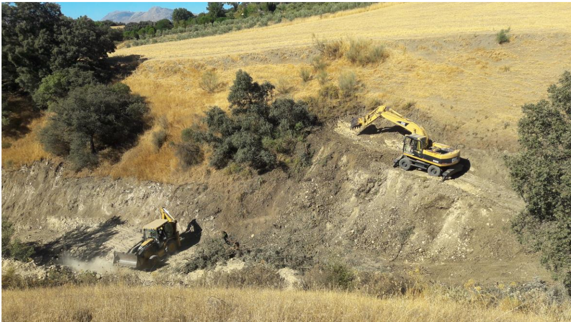
Trabajos en la ladera Oeste

Al otro lado del arroyo (Oeste) se desbroza la ladera y se va excavando un camino para que pueda trabajar mejor la máquina en las labores de realización del talud.