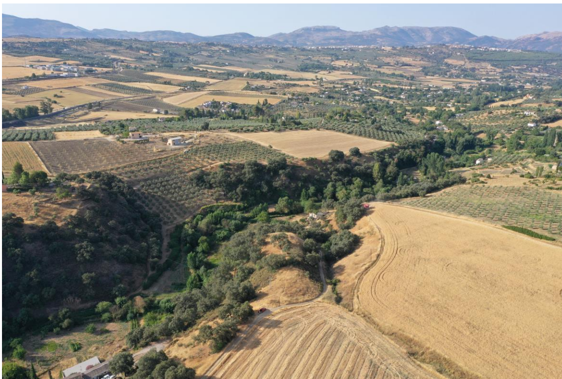
Vista general de la parcela con la Serranía de Ronda al fondo (Sur)

Los principales movimientos de tierra en la Planta han consistido en el desmonte de un cerro, el cual se ha rebajado unos 12 metros desde su cima, con el posterior relleno de unos 4 metros desde el arroyo seco, así como el rebaje de los taludes de dicho arroyo. Tras estos trabajos se estableció la plataforma sobre la que se ha edificado la Planta de la EDAR.