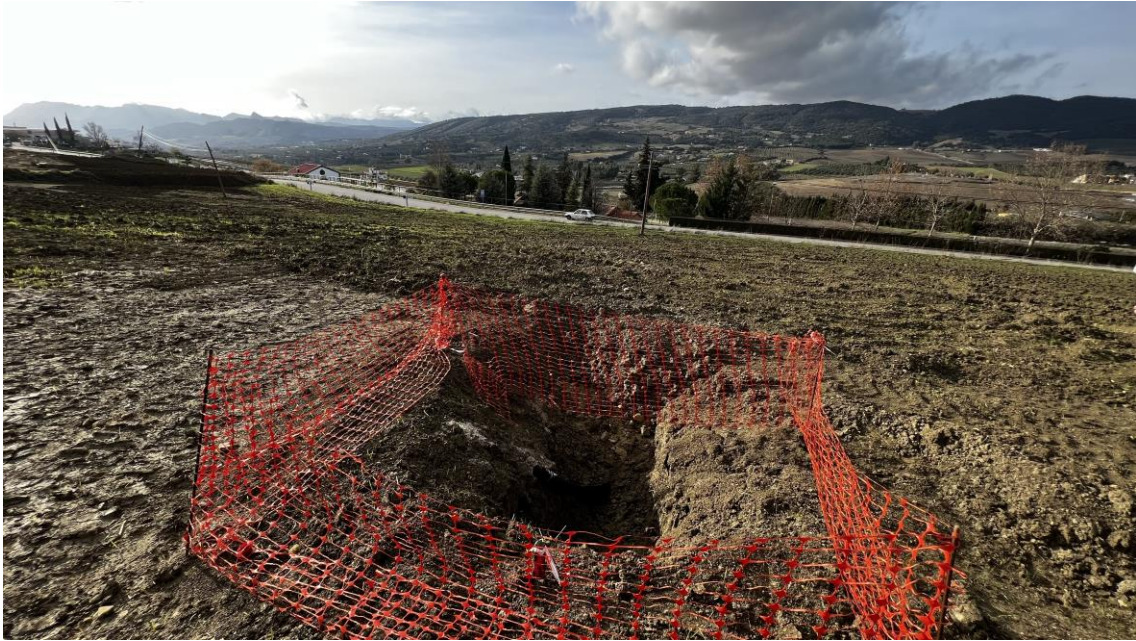
Trabajos de apertura de zanjas en el Colector G3