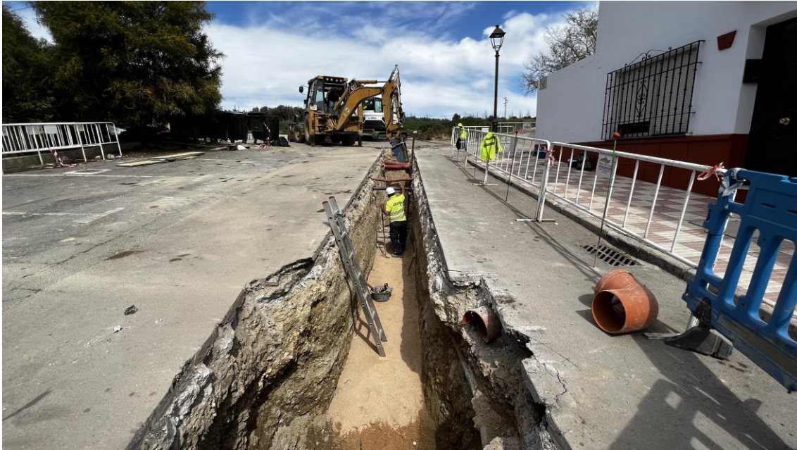
Trabajos de apertura de zanjas en Colector G4, pozo nº 33

El perfil estratigráfico de G4 está formado por una capa de asfalto, UE 001, de 0´05 metros de grosor, una cama de hormigón, UE 002, de 0´20 metros, una capa de zahorra, UE 003, de 0´15 metros, y un estrato de areniscas calcáreas biocalcarenitas, UE 004, de 0´45 metros de potencia. No se observan indicios arqueológicos de ningún tipo.