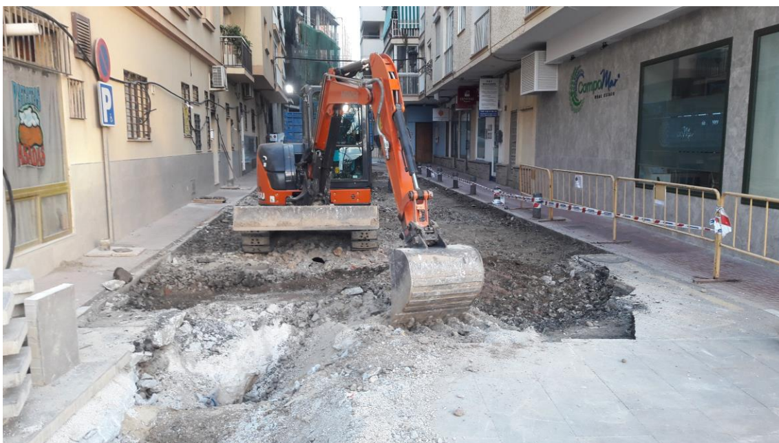
Trabajos de levantamiento del asfalto de la calle

Los trabajos se iniciaron en la calzada con el picado y levantamiento del asfalto y el empedrado que formaba su cama, UE 001, de unos 0'10 metros de potencia.