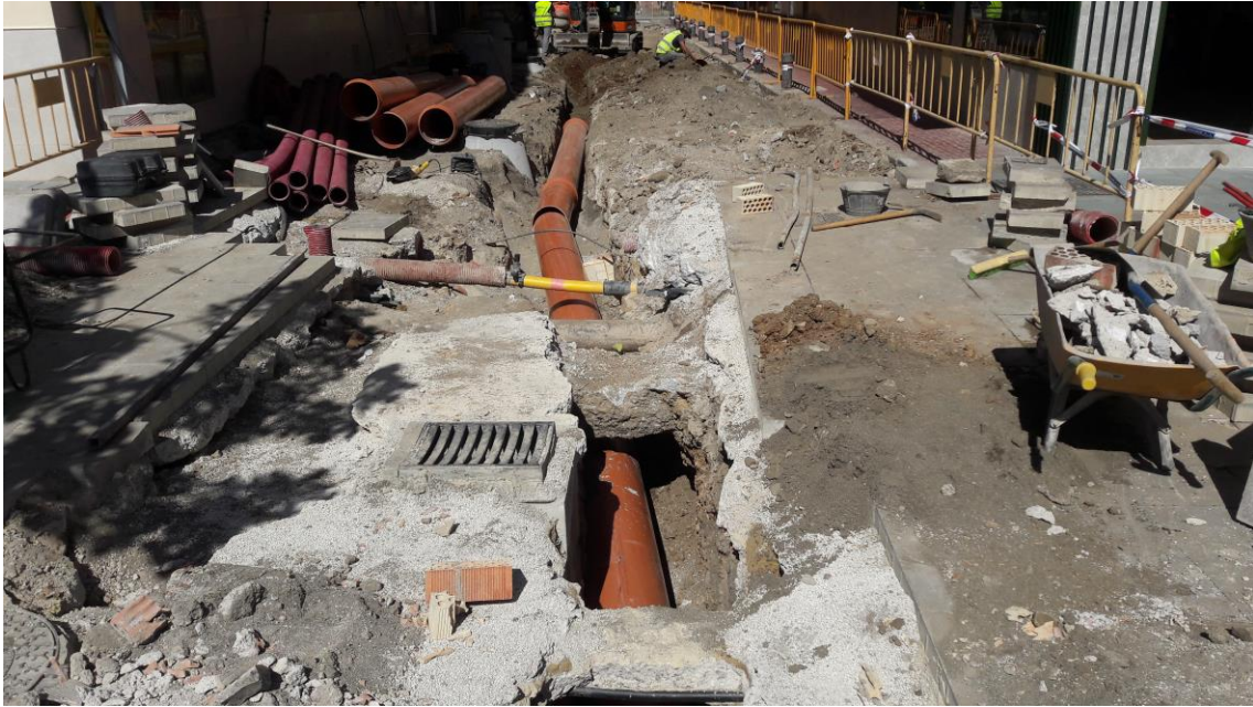
Vista de la calle con la tubería de pluviales