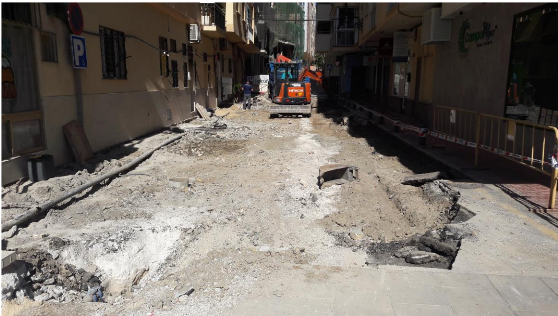
Vista de la calle tras eliminar una de las aceras

En la unión entre calle Delfín y la avenida de España se realiza una pequeña zanja de unos 4 metros para enganchar la nueva tubería de saneamiento a la red principal, que discurre por el Paseo Marítimo. Su anchura es de 0'80 metros y se alcanza una profundidad desde rasante de 1'40 metros. Ello es debido a que había que pasar la tubería por debajo de otras ya existentes. La estratigrafía resultante está compuesta por las losetas de la acera (UE 003), de 0'10 metros de potencia, una capa de hormigón (UE 004), de 0'20 metros, un estrato de arcilla marrón (UE 005), de 0'40 metros, y un estrato de arenas de playa (UE 006), de 0'70 metros de potencia, sin indicio arqueológico alguno.