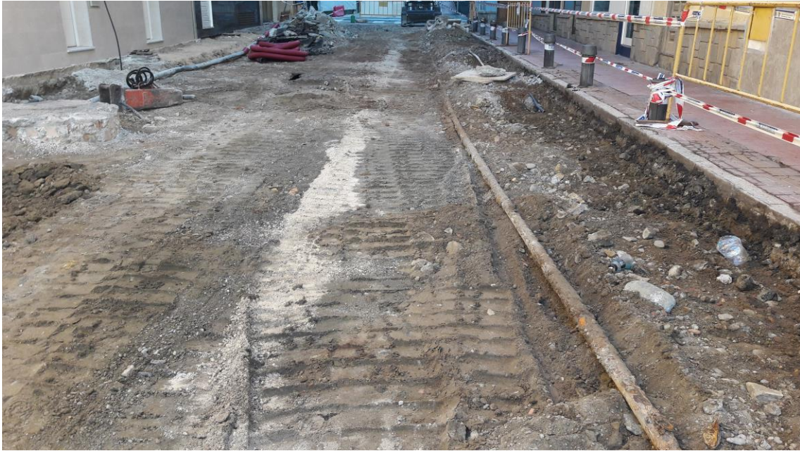
Vista de la calzada tras el rebaje