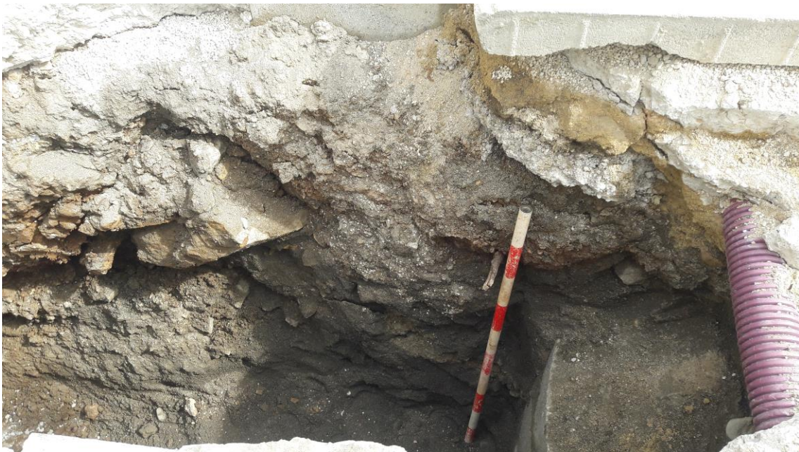
Perfil estratigráfico de la zanja

Por otro lado, se realiza una de las zanjas principales en el lado Oeste de la calzada para meter una tubería de saneamiento a lo largo de toda la calle. Se trata de una zanja de unos 40 metros de largo, 0'80 metros de ancho y 0'70 metros de profundidad desde la cota de excavación ya realizada en la calzada, lo que significa que se ha excavado en total 1'10 metros desde la cota actual de la calle. Los tubos que se han colocado son de pvc de color naranja, de un diámetro de 400 mm y una longitud de 6 metros.