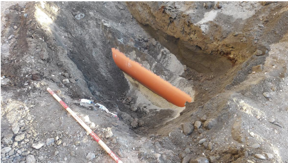
Vista de la tubería en el pozo

El perfil estratigráfico resultante en los pozos está formado por un estrato de relleno de tierra, UE 002, de 0´40 metros de potencia, y un estrato de arenas de playa, UE 006, de 0´80 metros de potencia, sin indicios arqueológicos.