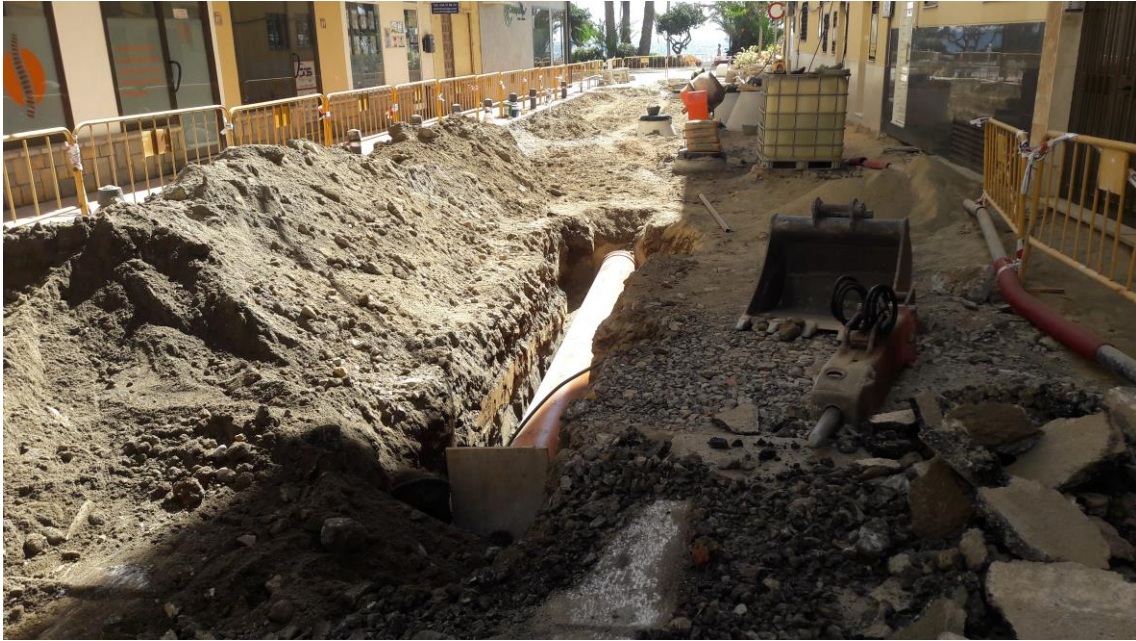
Vista final de los trabajos