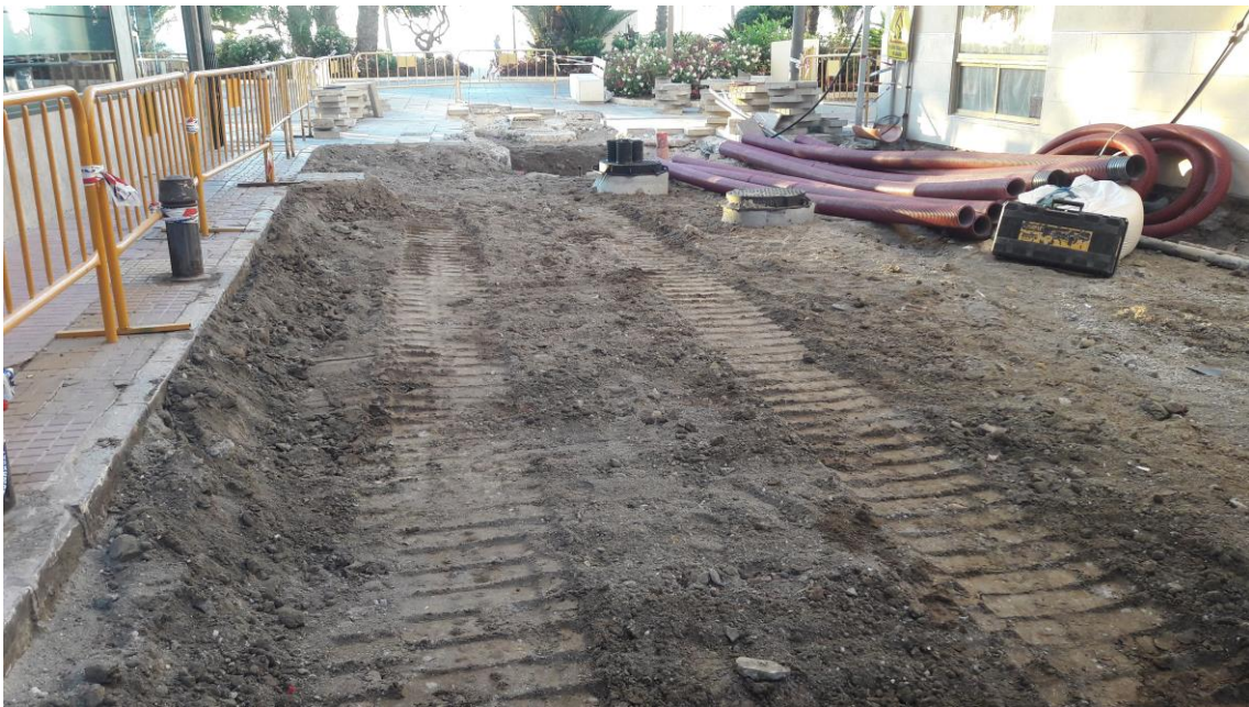
Vista de un tramo de la calle con los trabajos finalizados