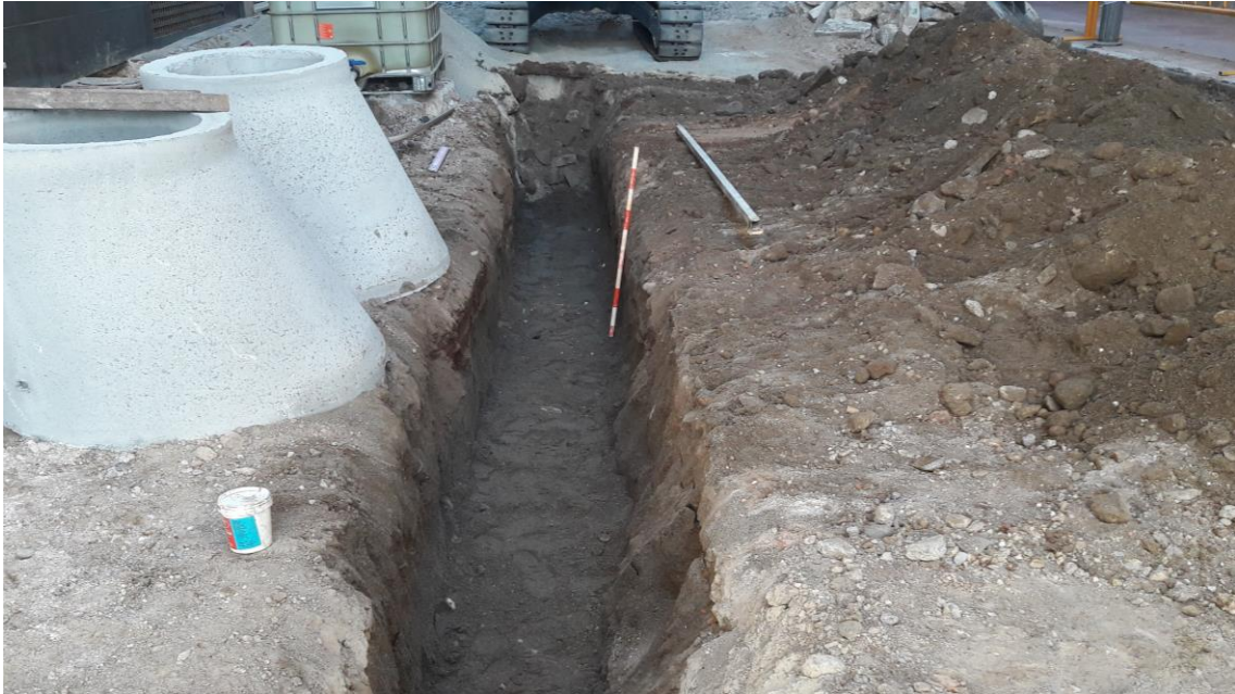
Zanja excavada para la tubería de saneamiento