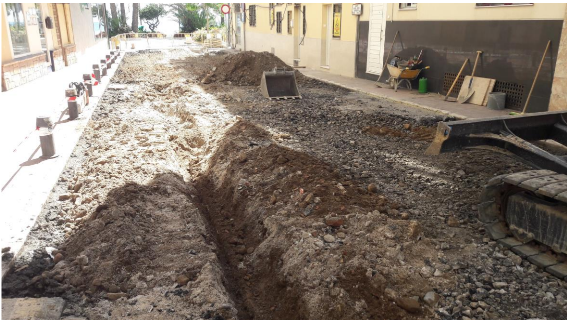
Desarrollo de los trabajos de excavación

Posteriormente, se pasa a rebajar unos 0'10 metros más en toda la calzada hasta alcanzar la cota de obra de -0'40 metros desde rasante. El terreno resultante es un relleno de tierra marrón suelta con pequeñas piedras (UE 002), con alguna capa de gravas en puntos determinado que sirvieron en su momento para cubrir las tuberías.