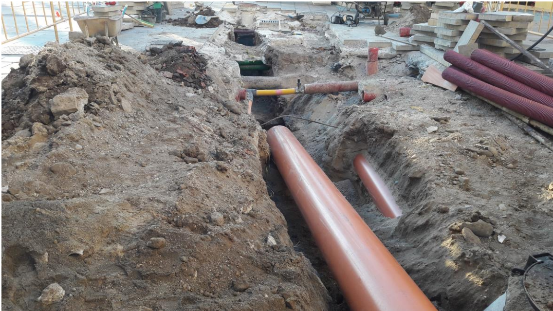
Tubería de pluviales junto a la de saneamiento

En el eje central de la calle se ha abierto una zanja de idénticas características y estratigrafía para la tubería de pluviales, que también desemboca en el Paseo Marítimo. Igualmente, se han excavado tres sondeos para tres pozos de registro.