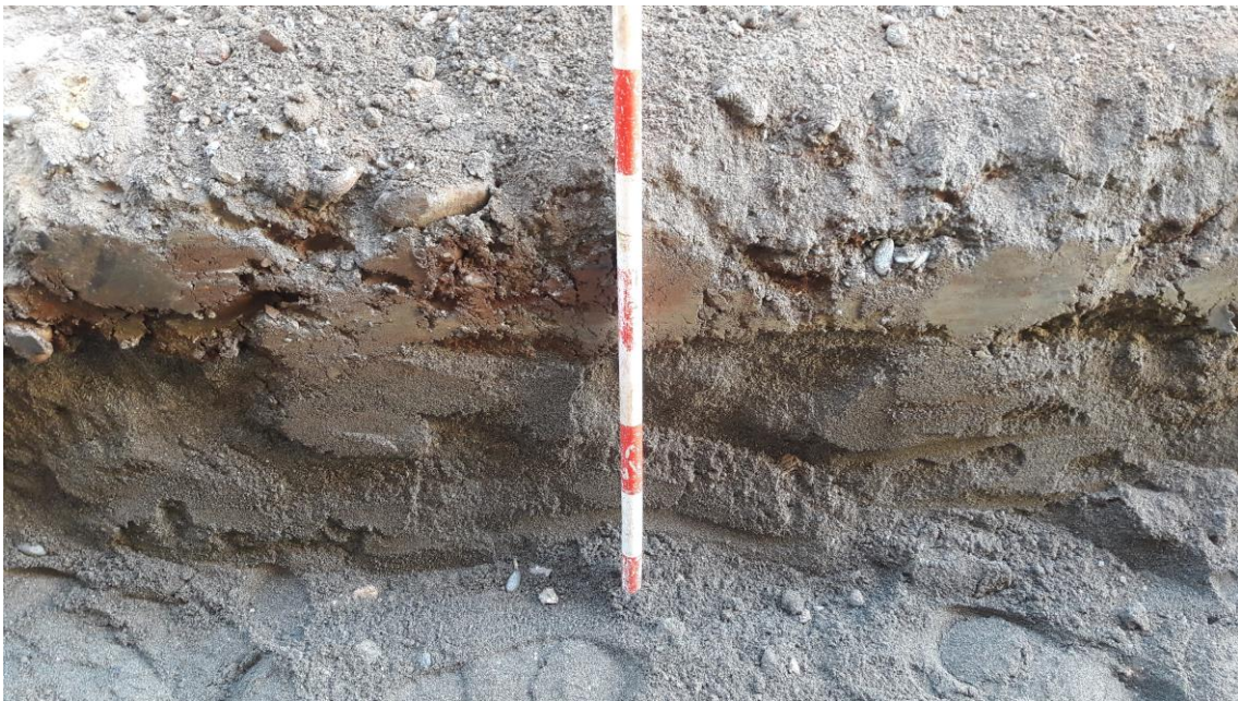
Perfil estratigráfico de la zanja de saneamiento

Además, se han realizado tres sondeos a lo largo de la zanja, donde se han colocado pozos de hormigón para registro del saneamiento. La excavación ha consistido en un cuadrado de 2 metros de lado ( 4 \text{ m}^2 ) y una profundidad media de 1 metro. Posteriormente se ha echado una capa de hormigón en el fondo y se ha colocado el pozo de hormigón sobre el tubo.