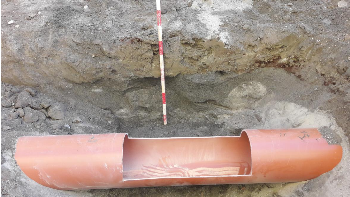
Perfil estratigráfico en el pozo

En el eje central de la calle se ha abierto una zanja de idénticas características y estratigrafía para la tubería de pluviales, que también desemboca en el Paseo Marítimo. Igualmente, se han excavado tres sondeos para tres pozos de registro.