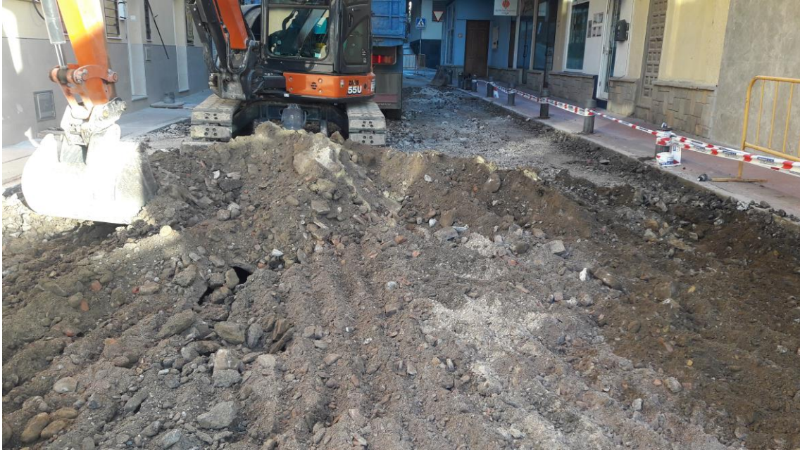
Excavación de los niveles de relleno de la calle

A continuación se procedió al rebaje mecánico de unos 0'20 metros en toda la calzada. Es en estos momentos cuando aparece una tubería de agua al Oeste de la calzada y una tubería de hierro al Este. Todo ello ralentiza los trabajos y obliga al desvío de las tuberías.