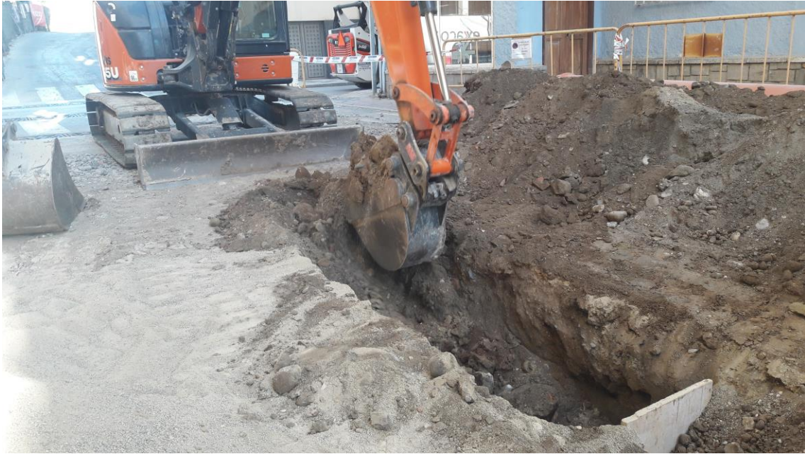
Excavación de la zanja de pluviales en la unión con calle San Roque