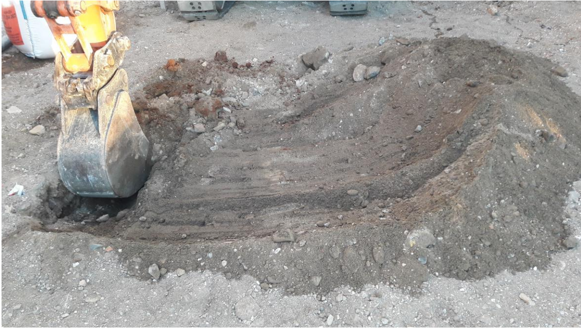
Excavación del pozo más próximo al Paseo Marítimo