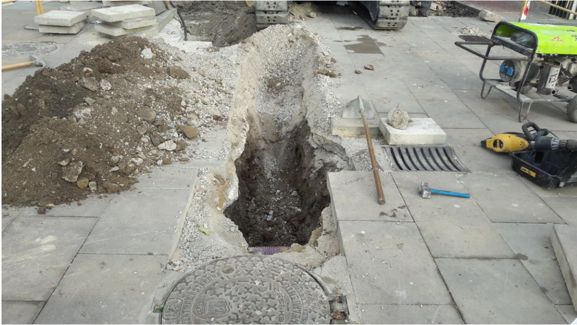
Zanja en el Paseo Marítimo