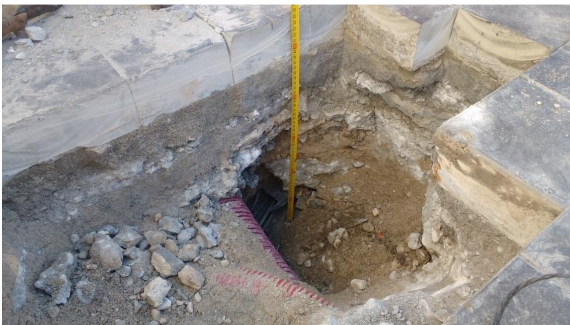
Lámina2. Sondeo en Arqueta 3

Anexa a la arqueta 3 se abre una cata retirando parte de los adoquines de la calle, rebajando un total de 57 cm. desde cota de rasante, registrándose el relleno de la propia calle mediante tongadas de cemento y zahorra.