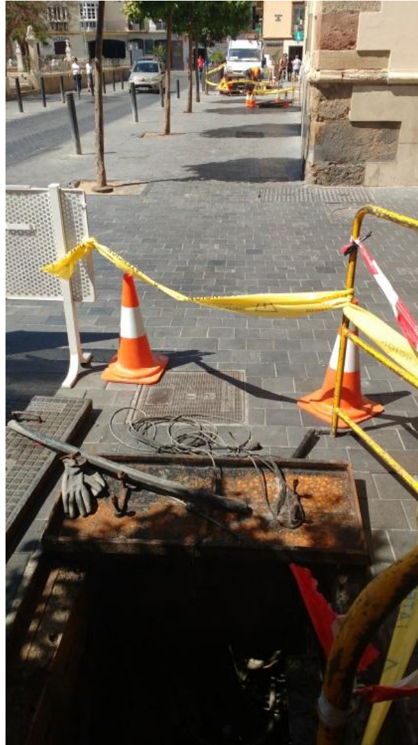
Lámina 3. Vista de acera de Plaza de la Merced con las arquetas abiertas

Una vez colocado el cable y cerradas las arquetas, se da por finalizado el CMT sin que se desprenda ninguna incidencia ni se deriven medidas correctoras relativas a esta actividad arqueológica.