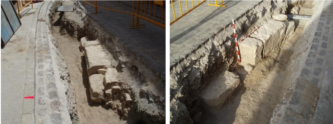
Lámina 3 y 4. Estructura de sillares UE 004 en calle Río.

observar que la zona central se asienta sobre la roca del terreno, por lo que se trata de la primera hilada. En el extremo opuesto encontramos dos hiladas con un pequeño sillar irregular sobre la primera hilada.