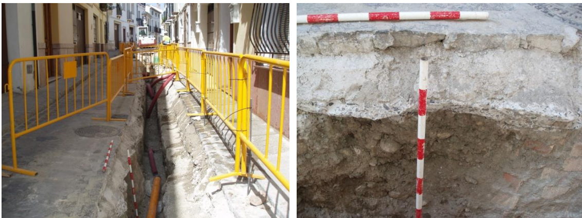
Lámina 1 y 2. Zanja en calle Río.

La única calle con resultados arqueológicos positivos ha sido la calle Río , donde se trabaja a finales de junio de 2015, muy cerca de la Alcazaba. Se abre una zanja a lo largo de toda la calle partiendo de la plaza del Carmen. Su longitud es de unos 200 metros, su anchura de 1'50 metros y su profundidad de 1 metro. La traza abarca toda la mitad norte de la calzada. Durante la excavación mecánica de la zanja se localizó a la altura del número 44 un sillar de piedra caliza en posición secundaria que nos puso en alerta sobre la importancia arqueológica de este sector de la obra. El sillar se sacó y se depositó en la nave de los servicios operativos del ayuntamiento de Antequera a instancias del arqueólogo municipal. Inmediatamente después aparecen más sillares, éstos en posición primaria, que conforman un muro localizado en el perfil sur de la zanja a la altura del número 42. A partir del número 33 de la calle va apareciendo un muro realizado en la propia roca hasta el número 29, siempre siguiendo la línea de la zanja. A partir de este número dejan de aparecer vestigios arqueológicos. La estratigrafía general de la calle muestra un nivel de adoquines (UE 001) de 0'10 metros de espesor, un nivel de hormigón de 0'20 metros (UE 002) y un estrato de tierra marrón producto del relleno para nivelar la calle (UE 003) de 0'70 metros de potencia.