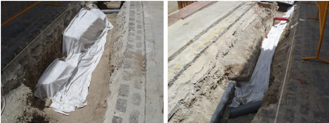
Lámina 10 y 11. Proceso de cubrición de los restos con tela geotextil.

A propuesta de las autoridades competentes, los restos hallados, una vez correctamente documentados, se han protegido in situ mediante cubrición con una tela geotextil, una capa de grava de al menos 10 centímetros encima, una capa de albero y una capa de hormigón, ajustándonos también a las necesidades de cubrición de la propia obra.