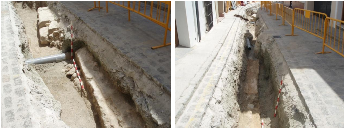
Lámina 5 y 6. Estructura de sillares UE 004 y muro UE 005 en calle Río.

A 1'30 metros de distancia hacia el oeste, y retranqueada casi un metro, aparece la línea de un muro labrado en la propia roca, de coloración rojiza (UE 005). Tiene una longitud de 16 metros, una anchura media de 0'60 metros y una profundidad en el punto donde se ha bajado más de 0'50 metros. Su línea no es regular, por lo que parece que se va adaptando a las curvas de nivel del terreno. A mediación del mismo falta un pequeño tramo por la afección de un registro actual.