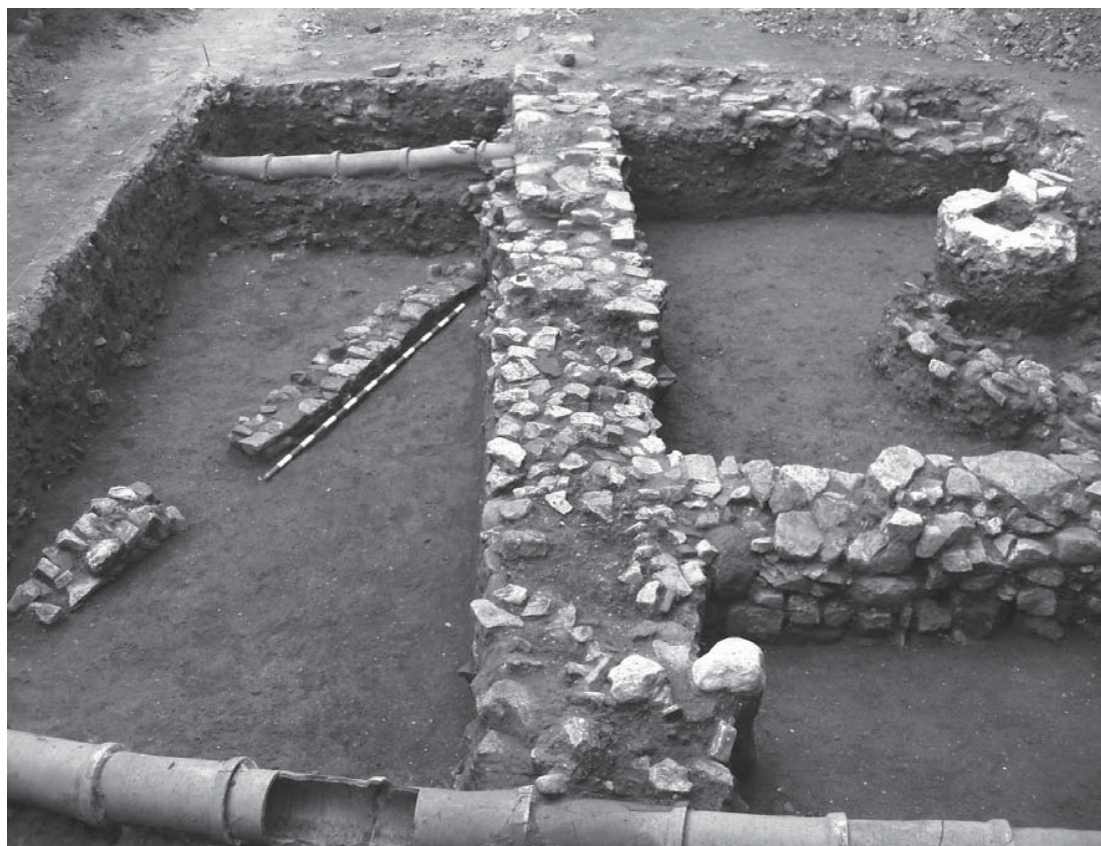
Lámina 1. Vista del muro musulmán bajo las estructuras contemporáneas.

Este solar está caracterizado por dos fases de ocupación claramente diferenciadas. El primer momento constructivo corresponde a la época musulmana, durante los siglos XI-XII. El segundo momento de ocupación pertenece a la época contemporánea (siglos XIX-XX).